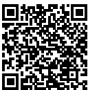
Tabelle 61.2 / Stand: 10.12.2020