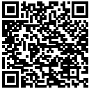
Tabelle 61.1 / Stand: 10.12.2020