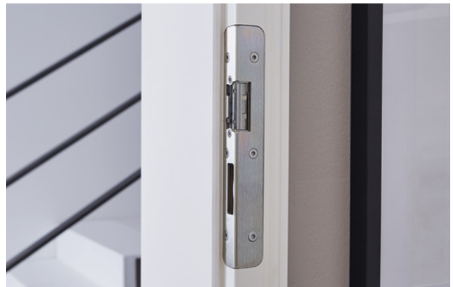
Schließblech mit E-Öffner