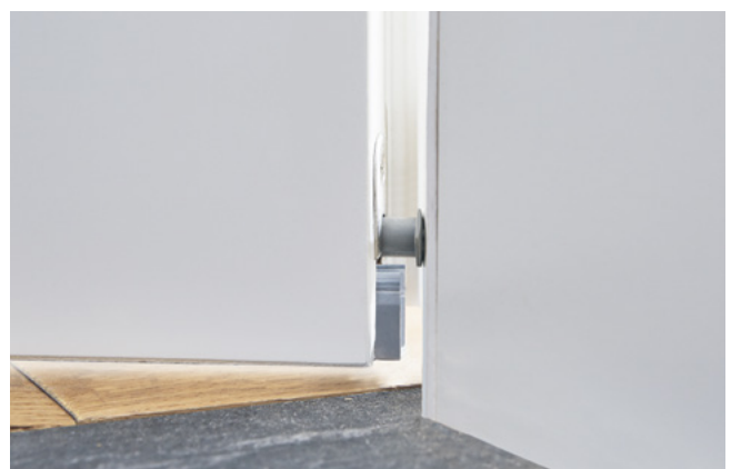
Bodendichtung mit Auslöser