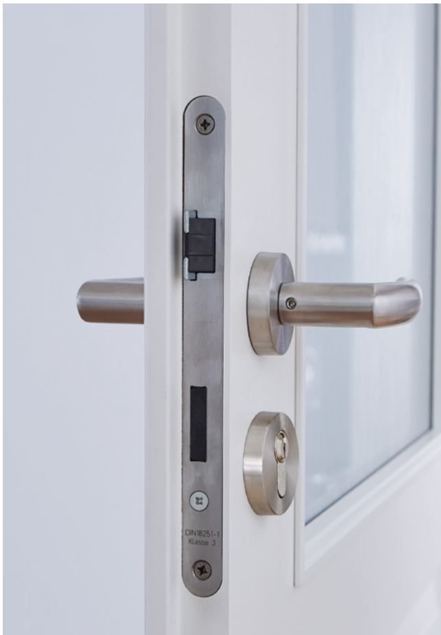
Beschlag SOFT mit PZ-Schloss