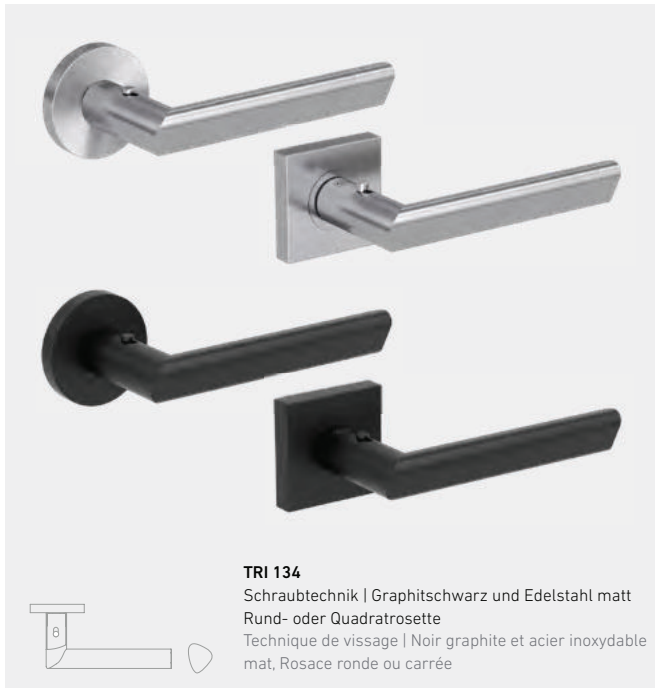
TRI 134 Schraubtechnik | Graphitschwarz und Edelstahl matt Rund- oder Quadratrossette Technique de vissage | Noir graphite et acier inoxydable mat, Rosace ronde ou carrée