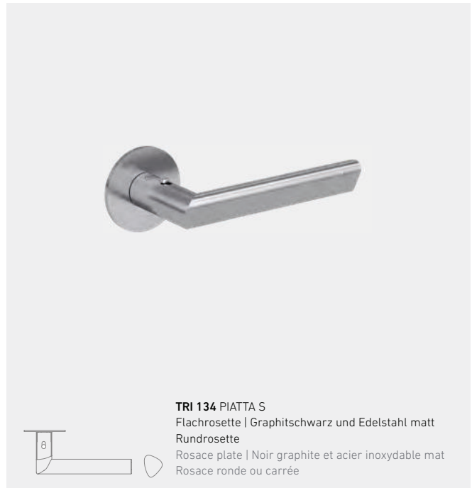
TRI 134 PIATTA S Flachrossette | Graphitschwarz und Edelstahl matt Rundrossette Rosace plate | Noir graphite et acier inoxydable mat Rosace ronde ou carrée