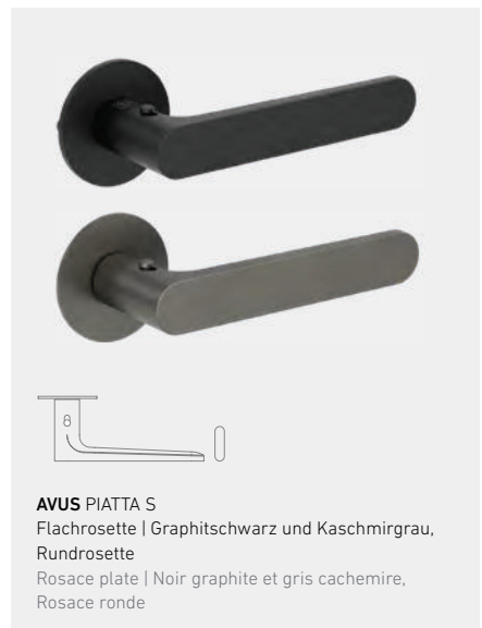
AVUS PIATTA S Flachrossette | Graphitschwarz und Kaschmirgrau, Rundrossette Rosace plate | Noir graphite et gris cachemire, Rosace ronde