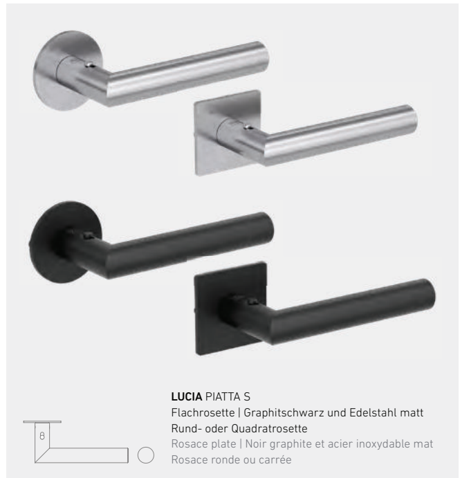
LUCIA PIATTA S Flachrossette | Graphitschwarz und Edelstahl matt Rund- oder Quadratrossette Rosace plate | Noir graphite et acier inoxydable mat Rosace ronde ou carrée