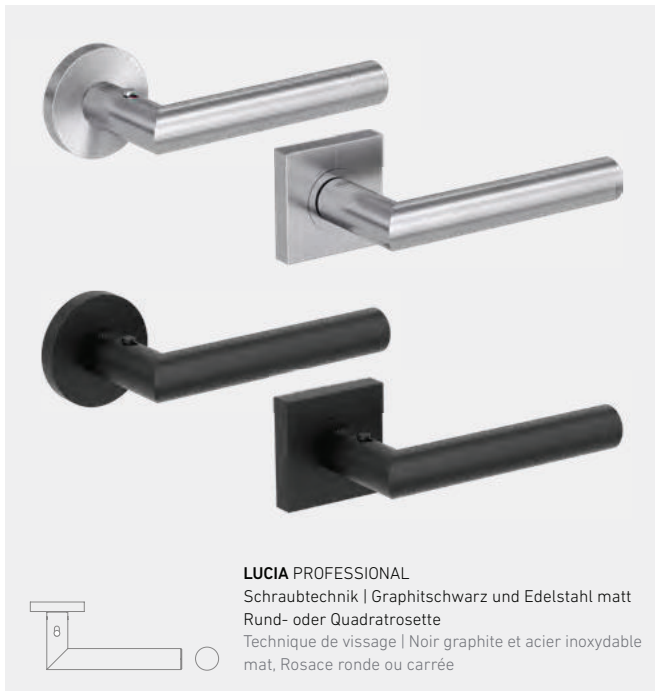
LUCIA PROFESSIONAL Schraubtechnik | Graphitschwarz und Edelstahl matt Rund- oder Quadratrossette Technique de vissage | Noir graphite et acier inoxydable mat, Rosace ronde ou carrée