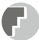
PK2 KANTE GEFÄLZT Doppelfalz möglich