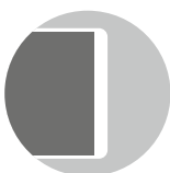
PK2 KANTE Stumpf möglich

Immer ein sauberer Abschluss: Die innovative Kantentechnologie steht für höchste Strapazierfähigkeit bei besten Reinigungseigenschaften. Der kleine Radius an der Aufdeck- und Falzseite macht die Garagenverbindungstüre zum optischen Highlight.