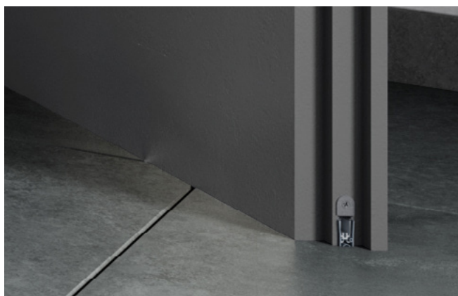
Automatisch absenkende Bodendichtung