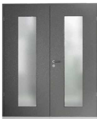
Doppelflügelige Tür mit Lichtausschnitt